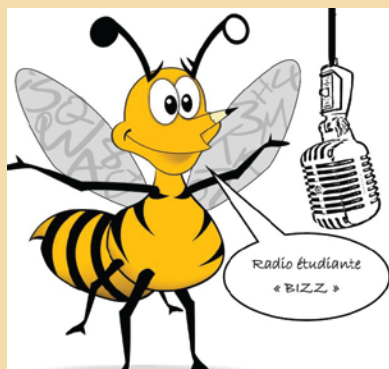
Le logo de la Radio étudiante BIZZ à l'école primaire de Rivière-Verte met en vedette la mascotte de l'école.