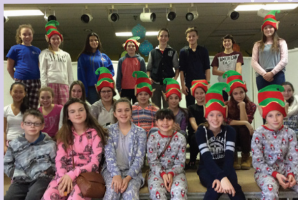
Les élèves du comité responsable du projet entrepreneurial « Les petits lutins! »

Nous apprécions vraiment les dons que tout le monde nous a donnés et nous espérons amasser beaucoup d'argent pour les cadeaux de Noël. Nous remercions tous nos partenaires! 📌